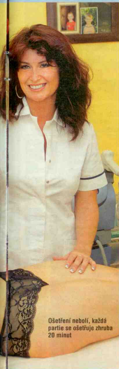
Ošetření nebolí, každá partie se ošetřuje zhruba 20 minut